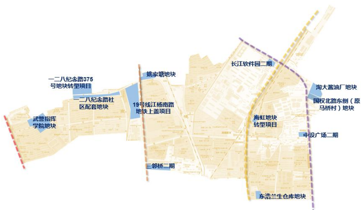
表：十四五期间重大产业项目一览表